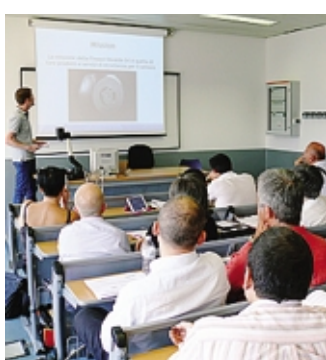
Artigiani a lezione

I temi approfonditi spaziano dagli strumenti manageriali per affrontare gli aspetti del-