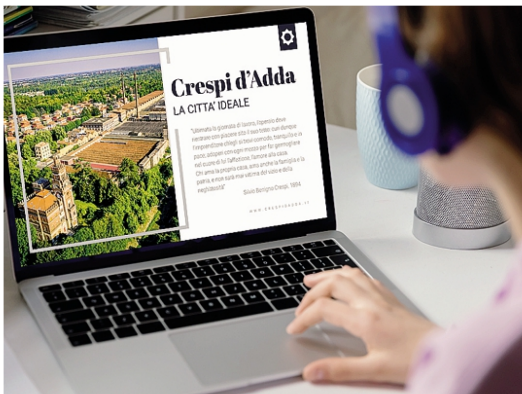
L'assemblea di Confartigianato Bergamo si svolgerà al Visitor Center del villaggio operaio di Crespi d'Adda

«Anche quest'anno - permette il presidente Giambellini - abbiamo scelto un luogo inconsueto per svolgere la nostra assemblea. Se un anno fa ci trovavamo in Accademia Carrara a parlare della bellezza e dei valori del lavoro quali leve per il rilancio del nostro territorio e delle professioni, Crespi sarà una location adatta per discutere di futuro delle politiche energetiche. Un cotonificio e un villaggio di fine Ottocento, creati dalla lungimiranza di un imprenditore illuminato e pionieristico come Cristoforo Benigno Crespi, coniugando produttività e welfare aziendale, ci appaiono infatti in tutta la loro modernità: un esempio di autosufficienza anche sotto il profilo dell'approvvigionamento energetico, che ci potrà offrire interessantissimi